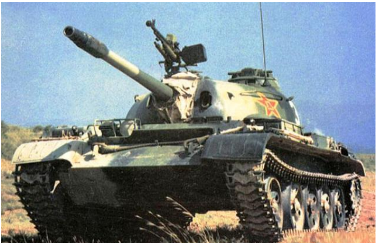
รถถังรุ่น Type 62 ผลิตจากประเทศจีน พัฒนาจาก Type 59 โดยลดขนาดของปืนให้เล็กลง เพื่อลดน้ำหนักของรถ