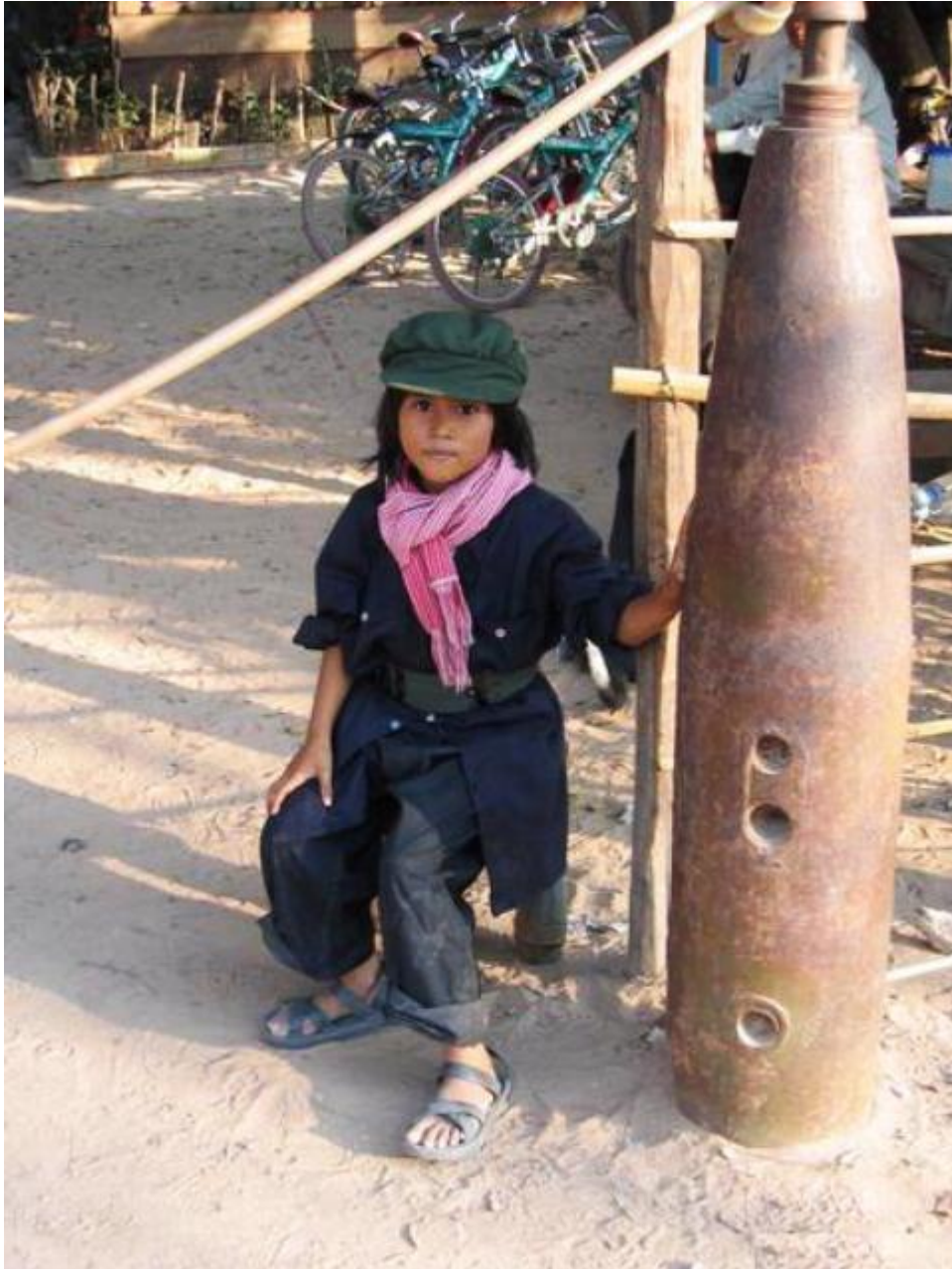
ลูกเด็กแดงก็ยังทันเห็นสงคราม รุ่นเขมร 4 ฝ่าย นี่ทางไซเวียดไม่แตกในปี 2534 จนเป็น 15 ประเทศในปัจจุบัน 'ไม่รู้ว่ สมัยนี้จะจบการรบหรือยัง