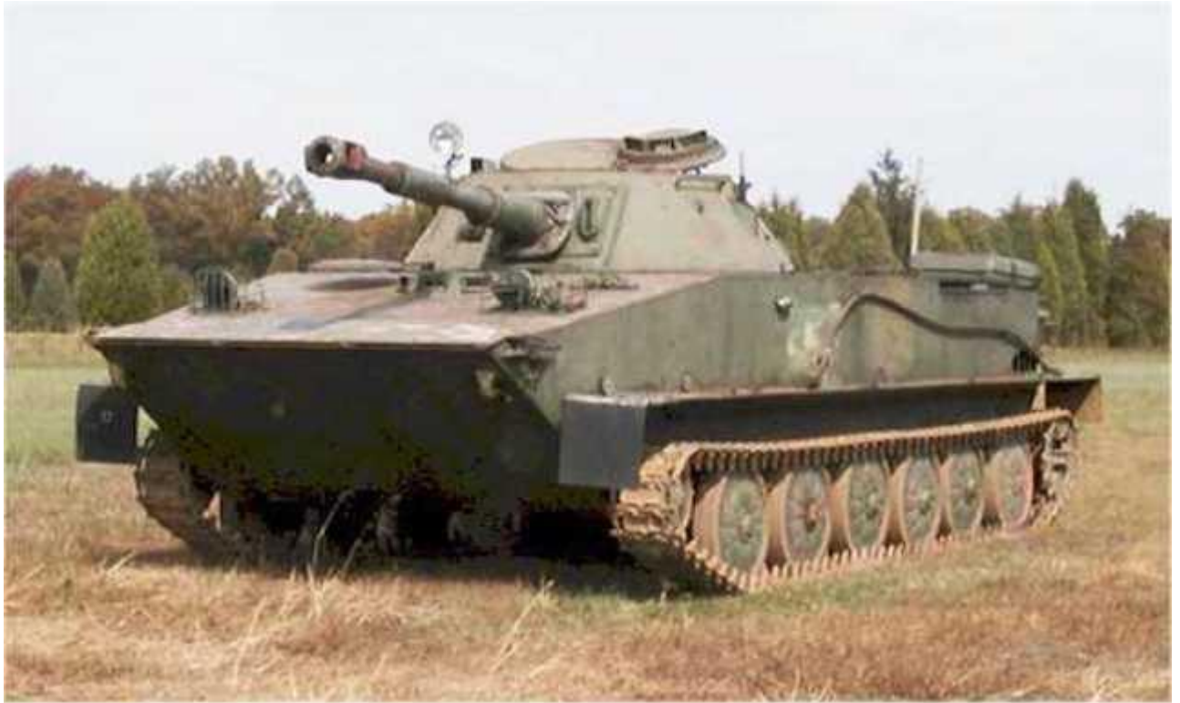
รถถังรุ่น PT-75 /76ทำในโซเวียตเป็นรถสะเทินน้ำ สะเทินบก สามารถวิ่งในน้ำได้เหมือนเรือ ผลิตตั้งแต่ปี 1950 เก่ามากแล้ว