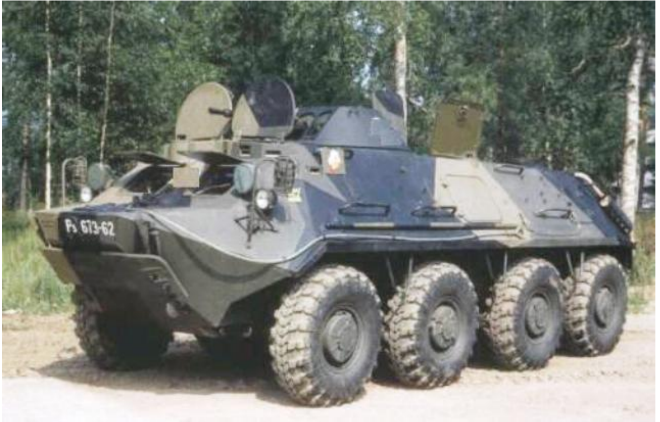
รถลำเลียงพลหุ้มเกราะ รุ่น BTR-60 ผลิตจากประเทศรัสเซีย รุ่นนี้ฮิตมากในค่ายคอมมิวนิสต์เป็นรุ่นแรก ๆ สำหรับยานลำเลียงพลของอดีตโซเวียต