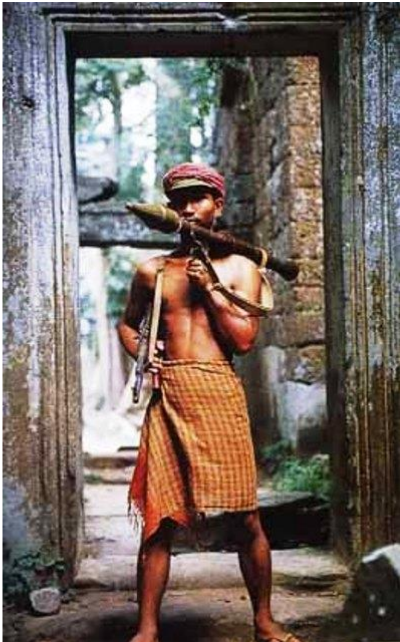
สำคัญของหนูนและประชาชน ก็มีความเชี่ยวชาญในการรบ ทั้งการรบในแบบ และการรบนอกแบบ การรบแบบกองโจร