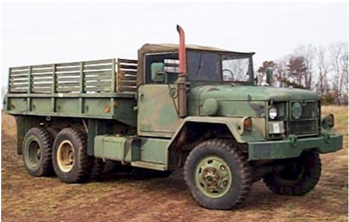
รถขนส่งกำลังพล M35A2 ผลิตที่ประเทศสหรัฐฯ ใช้ลำเลียงทั้งกำลังพล และใช้ในหน่วยพาราช เป็นรถลำเลียงพลที่มีความทนทานสูงสามารถบันทึกหนักได้ และขับเคลื่อนหายห่วง แต่เอาไปวิ่ง 3 จว.ภาคได้ไม่ได้ เดี่ยวพวกฝั่งระเบิดได้ถนนแล้วกดตุ้มหมายท้องต้องพลีชีพ