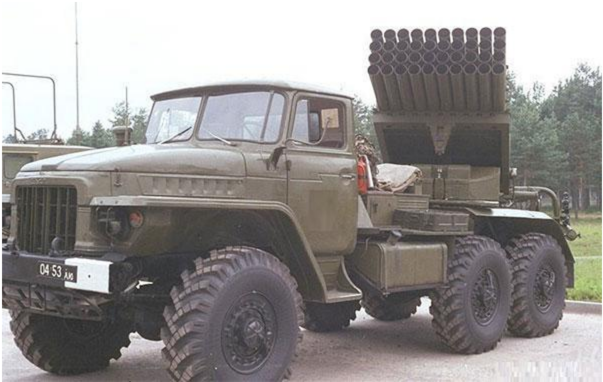
รถยิงจรวดรุ่น BM21 ติดตั้งเครื่องยิงจรวดหลายลำกล้อง 122 มม. ผลิตจากประเทศไทย เจ้านี้มีชื่อเล่น Grad หรือแปลว่า ห่ากระสุน