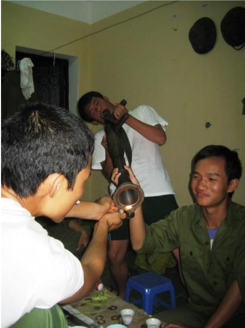
ทหารเขมรอยู่กับอาวุธจนแทบจะเป็นเรื่องปกติ หรือเข้าไปอยู่ส่วนหนึ่งในชีวิตไปเลยก็ได้