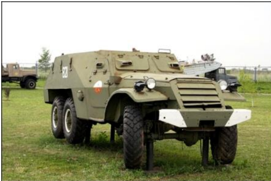
รถลำเลียงพลหุ้มเกราะ รุ่น BTR-152 ผลิตจากประเทศรัสเซีย ได้รับการพัฒนาจากรุ่น BTR60 รุ่นนี้ไม่สามารถวิ่งในน้ำได้