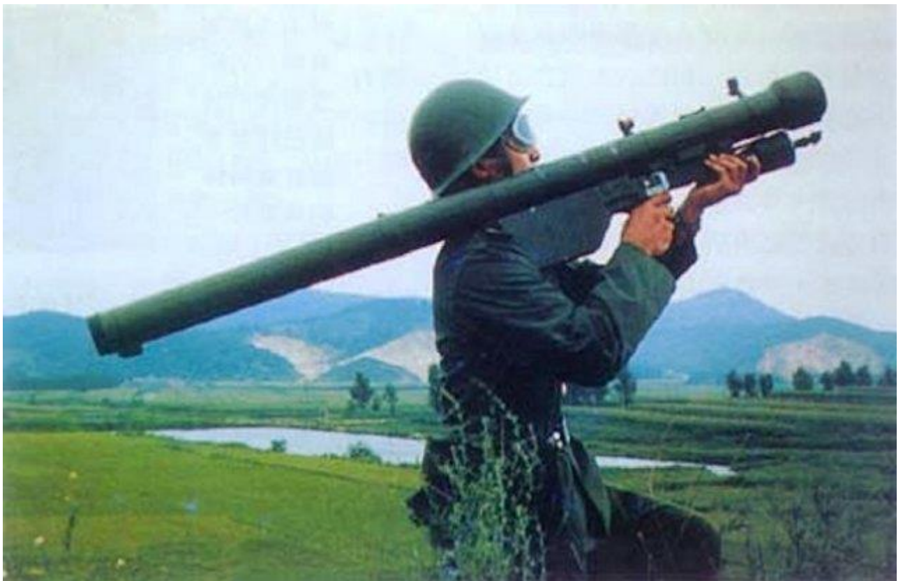
ปืนยิงเครื่องบิน 9K32 "Strela-2" ทาง NATOเรียก SA-7 Grail หรือที่เรียกกันในวงการทหารว่า ซาร์ ผลิตโดยรัสเซีย ยิ่งแล้วจรวดจะตามจับความร้อนของเครื่องบินรบ