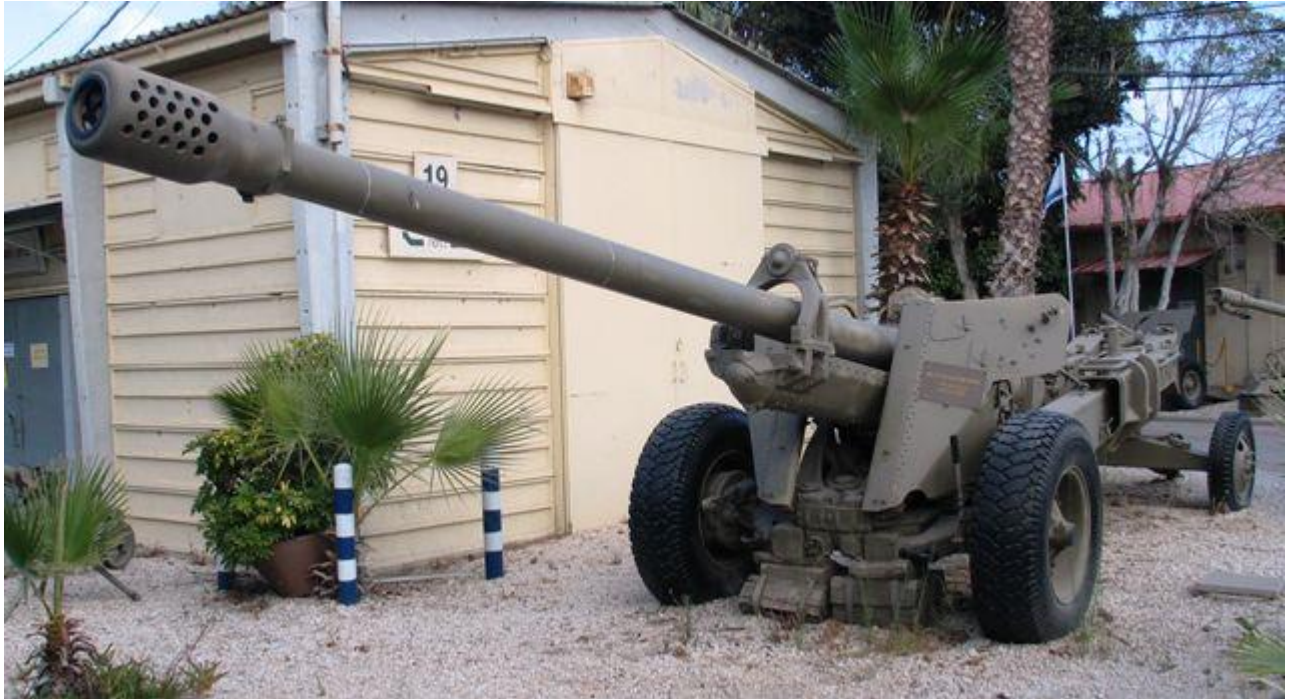
ปืนใหญ่ 130 มม.(Towed Field Gun) ผลิตที่ประเทศรัสเซียเรียก M1954 (M-46) รุ่นนี้ยิงวิถีราบยิ่งง่ายกว่าปืนใหญ่ของไทยค่าย USA ยิงวิถีโค้งต้องคำนวณเหมือนตอนเรียนวิชาทหารปกติสีแดง นั่งคำนวณบนเขาคอนกรีตดูแล้วตบกบาล เสือกยิงพวกเดียวกันเอง(แล้วปล่อยให้เข้าตีซุ่มเป้าชี้ของเมียครู)